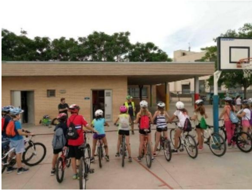
adults: Btt i E-Bikes de lloguer.

També organitzem activitats a escoles, instituts i altres centres de formació.